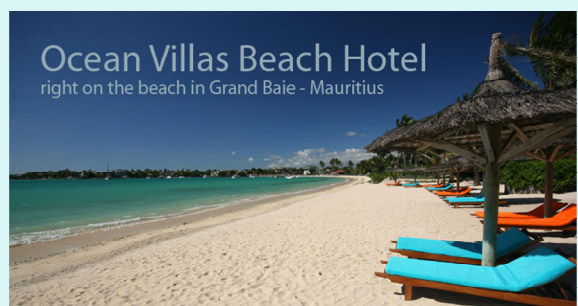
Ocean Villas Beach Hotel right on the beach in Grand Baie - Mauritius